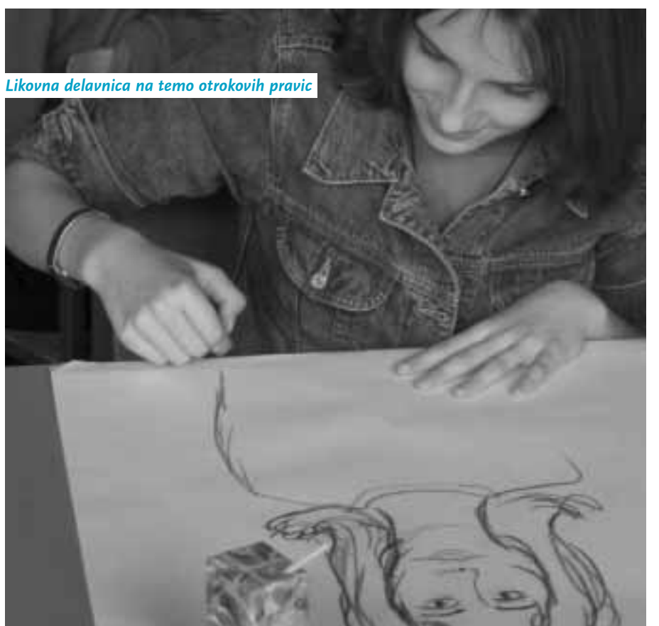
Likovna delavnica na temo otrokovih pravic