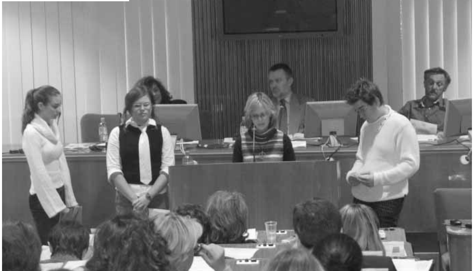
Strokovni posvet Nasilje v družini - poti do rešitev

Sporočila posveta so bila torej jasna. Največja težava pri premagovanju nasilja v družini je nesodelovanje različnih strok, za kar bi bilo treba imenovati nacionalnega koordinatorskega, ki bi omogočil sodelovanje med strokami in s tem ne zgolj pomoč žrtvam nasilja, temveč tudi preventivno ukrepanje in ozaveščanje javnosti. Za doseg tega cilja je seveda treba proučevati konkretne primere ter na njihovi podlagi ugotoviti delovanje različnih služb, je še poudarila generalna državna tožilka Zdenka Cerar. Varuh človekovih pravic Matjaž Hanžek pa je ob koncu napovedal ponovno srečanje čez leto dni, ko bodo lahko vidni rezultati, ki jih nekatera ministrstva že dalj časa napovedujejo.