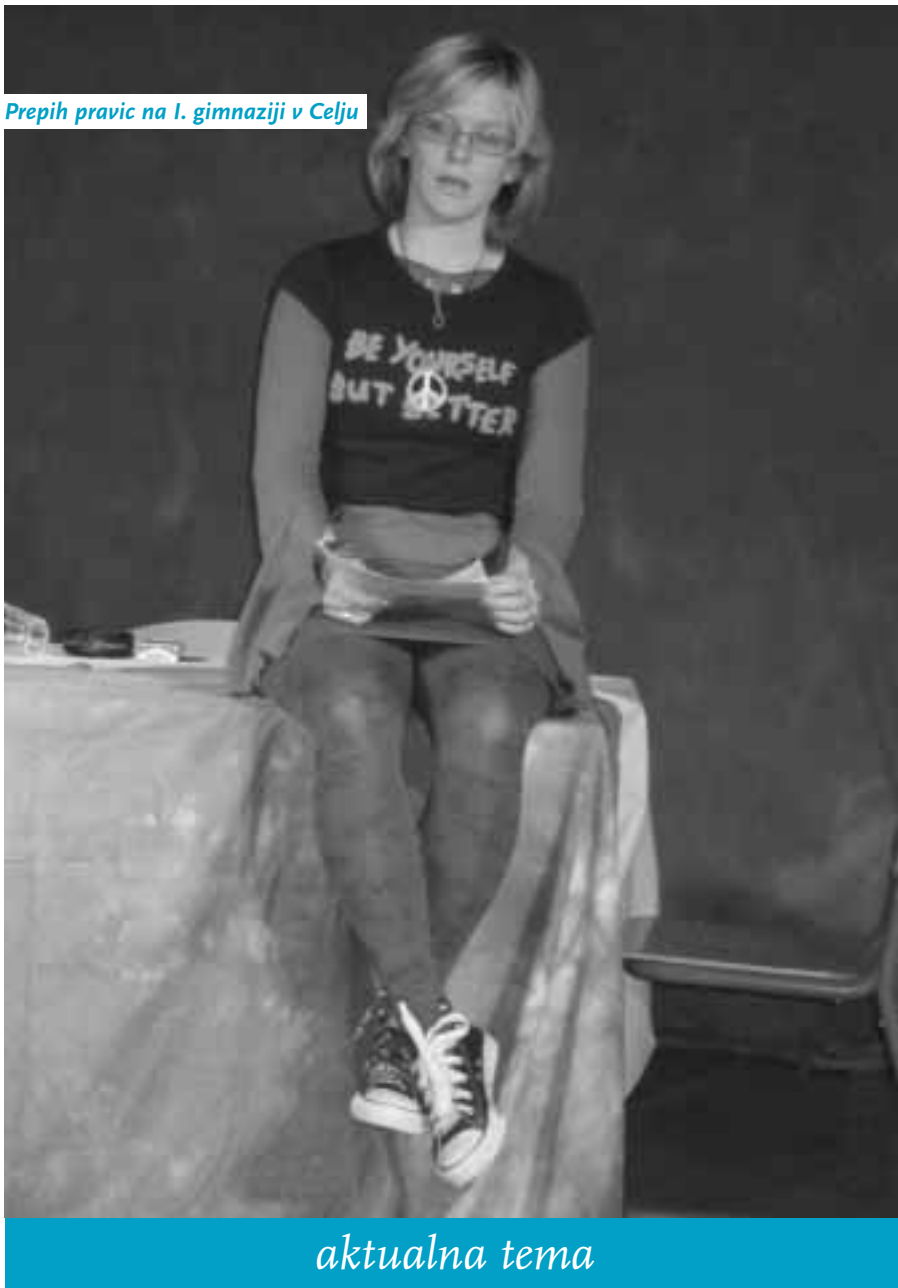
Prepiz pravice na I. gimnaziji v Celju