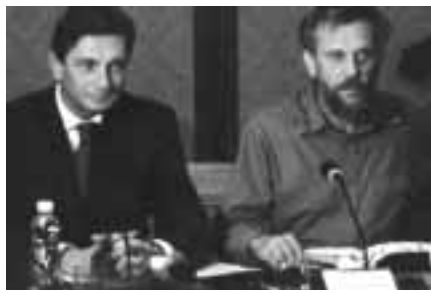
Okrogla miza o nacionalni instituciji za človekove pravice

Tudi večina predstavnikov slovenskih vladnih in nevladnih organizacij je podprla zamisel o nastanku posebne nacionalne institucije za človekove pravice, ki bi lahko po mnenju neka-