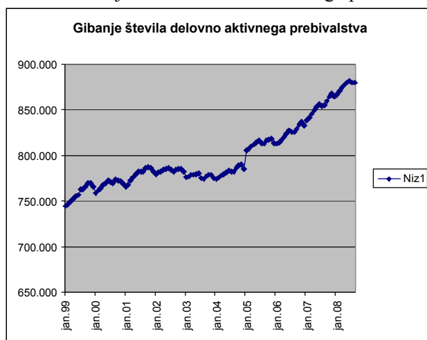
Graf 1: Gibanje števila delovno aktivnega prebivalstva (januar 1999 – januar 2008)

Vir podatkov. http://e-uprava.gov.si/ispo/delovnoprebivalstvo/prikaz.ispo