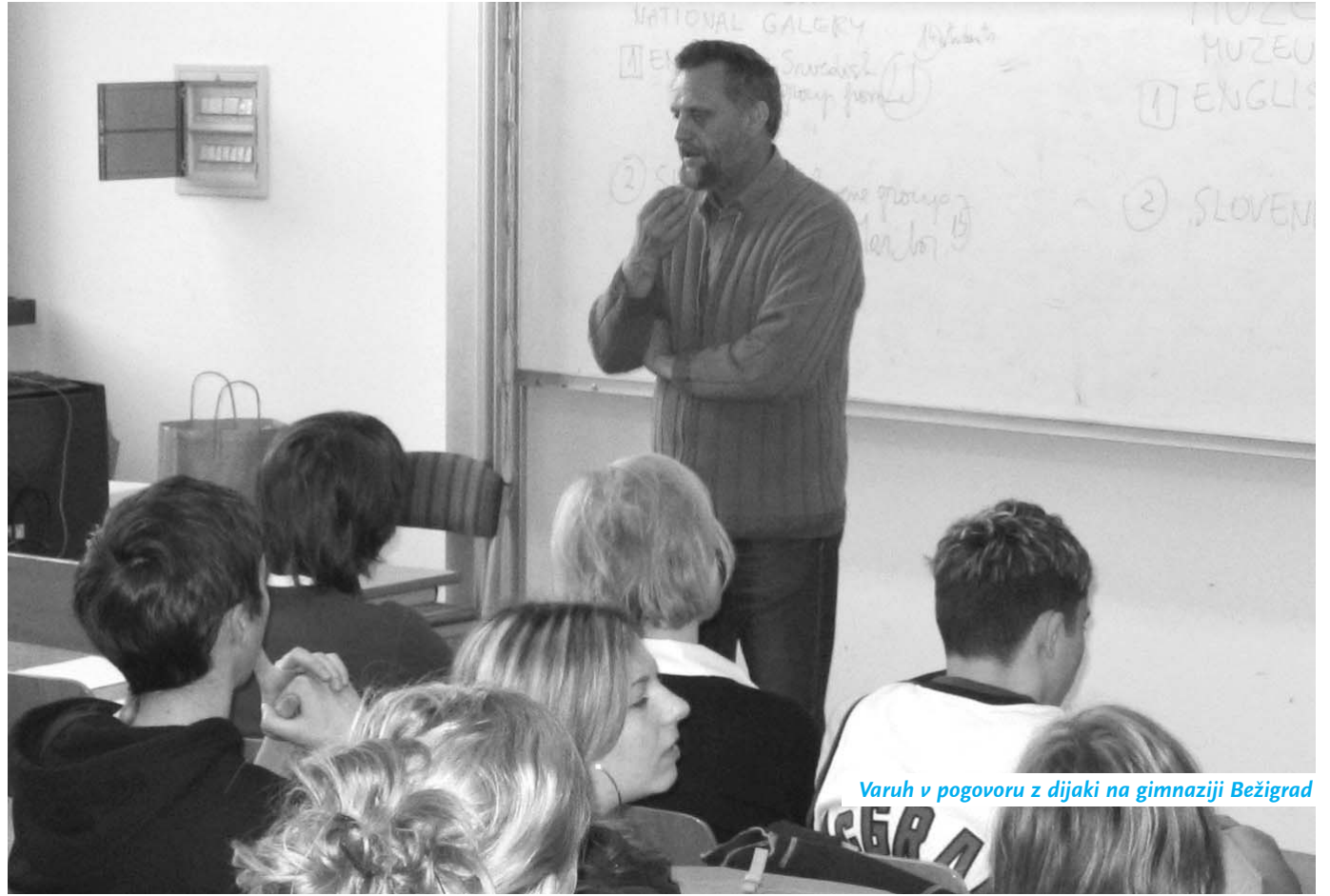
Varuh v pogovoru z dijaki na gimnaziji Bežigrad

Dijake mednarodne mature iz Kristianstada na Švedskem je zanimalo predvsem delovanje slovenskega varuha na področju otrokovih pravic. Varuh jim je v ta namen predstavil oddelek za otrokove pravice, ki pri varuhu človekovih pravic deluje že dve leti, ter najbolj pereče kršitve, ki pestijo slovenske otroke in mladostnike. ■