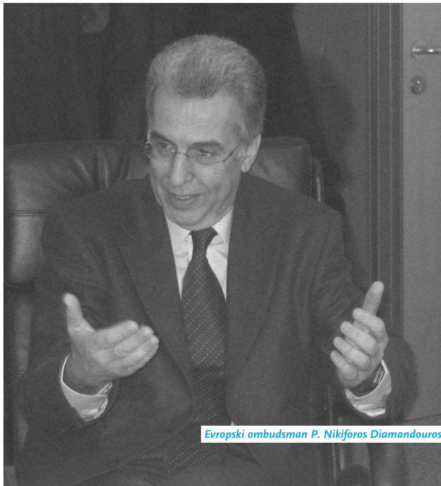
Evropski ombudsman P. Nikiforos Diamandouros

Da bi bil dober zgled javne službe, ombudsman obravnava pritožbe, kolikor je mogoče hitro. Njegov cilj je potrditi prejem pritožb v enem tednu, odločiti se o sprožitvi preiskave v enem mesecu in končati večino preiskav v enem letu. Ker je nekatere pritožbe mogoče rešiti s preprostim telefonskim klicem, medtem ko bolj zapleteni primeri lahko vključujejo predlog za sporazumno rešitev, okvirno priporočilo ali celo posebno poročilo Evropskemu parlamentu, ne bi bilo reprezentativno podati povprečnega števila. Kljub temu je naš cilj končati večino preiskav v enem letu.